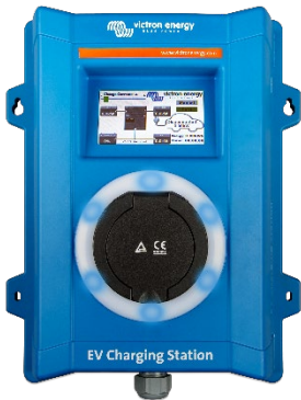
EV Charging Station