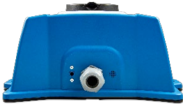
EV Charging Station - posterior