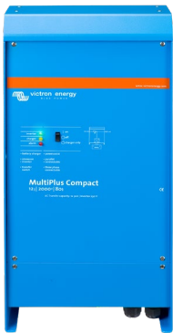
MultiPlus Compact 12/2000/80