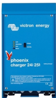
Carregador Phoenix 24V 25A