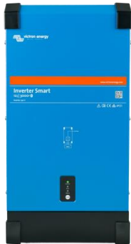
Inversor Smart 12/3000