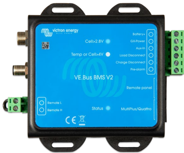
VE.Bus BMS V2